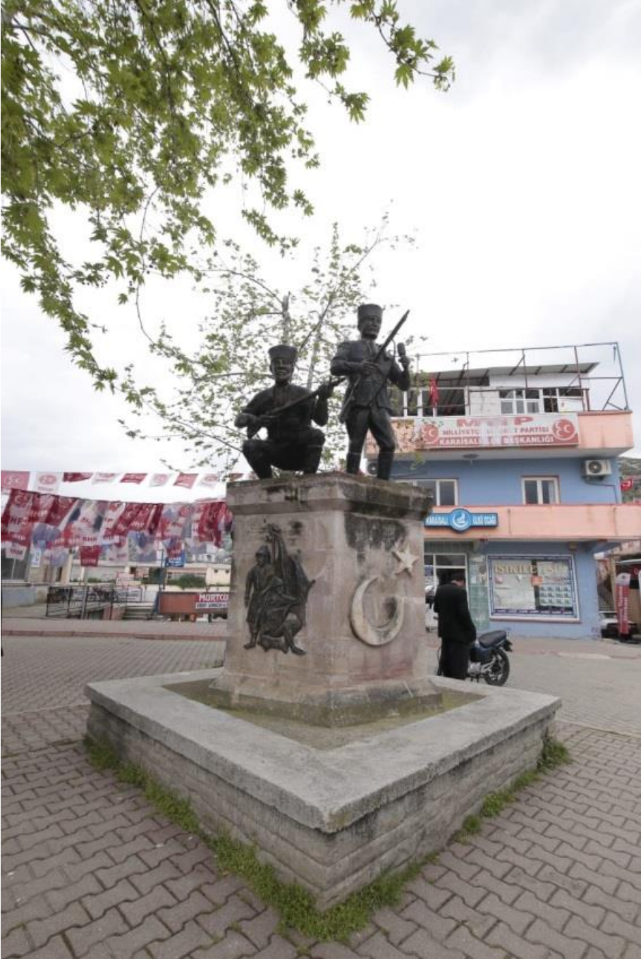
Resim 1: Karaisalı Kuva-yı Milliye Anıtı.