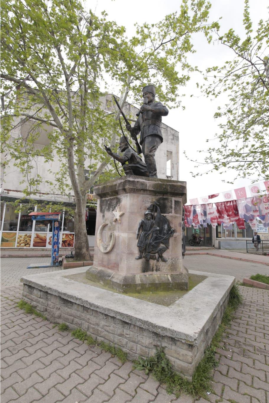
Resim 2: Karaisalı Kuva-yı Milliye Anıtı.